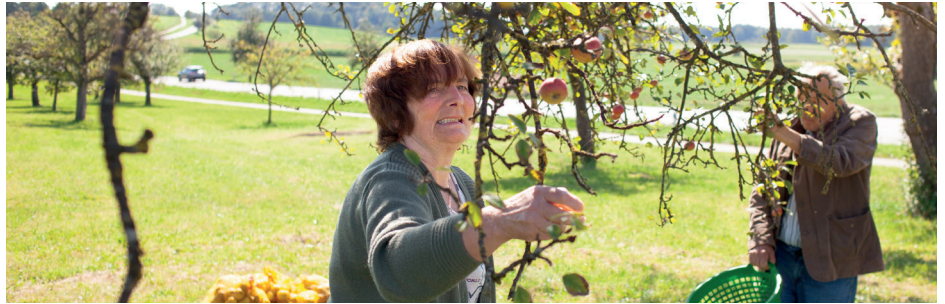
Betreutes Wohnen ermöglicht den betroffenen Menschen in einer lebendigen Gemeinschaft zu wohnen.

Wenn Sie als Gastfamilie, ein Zimmer im familiärem Umfeld anbieten möchten, ist die Hauptsache, dass „die Chemie stimmt“. Zeit miteinander verbringen, im Alltag klar