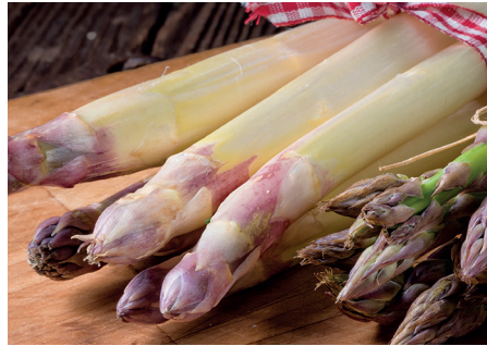
Lecker in der Spargelzeit: Spargel-Rucola-Salat in Kartoffel-Dressing mit gegrillten Schinken

Den Rucola putzen und waschen, gut abtrocknen lassen und zur Seite stellen. Spargel waschen, die unteren Enden großzügig abschneiden und gründlich schälen.