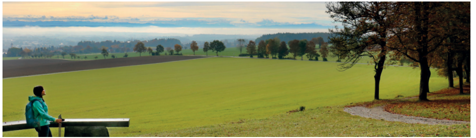
Beim Wandern durch Bad Schussenried und Bad Buchau lacht die Seele.