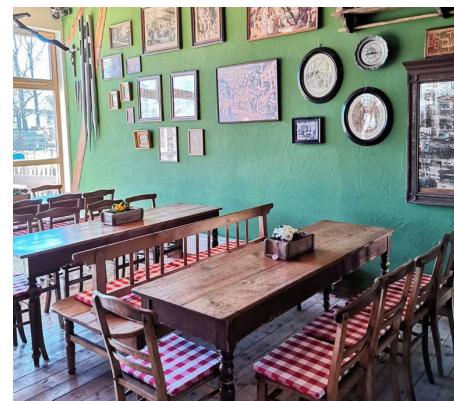
Willkommen in der Kürnbacher Vesperstube mit neuem Konzept und jungen Gastronomen.

Das familienfreundliche Restaurant neben dem großen Abenteuerspielplatz des Museums hat auf Selbstbedienung im gesamten Gastronomie-Bereich umgestellt. Während der Saison des Museumsdorfs Kürnbach von März bis Oktober ist die Kürnbacher Vesperstube täglich von 10-18 Uhr geöffnet und freut sich auf zahlreiche Gäste.