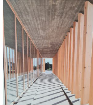
Kunstwerke von Dieter Krieg, Holzskulpturen von Manfred Wasner und die Fotoausstellung „Beispielhaftes Bauen“ sind aktuell im Kloster zu sehen"

Derzeit sind im Kloster Schussenried gleich drei neue Ausstellungen zu sehen. Es gibt Gemälde von dem Lindauer Künstler Dieter Krieg, Skulpturen aus Fundhölzern von Künstler Manfred Wasner aus Aulendorf. Und wer sich für Architektur interessiert, der kommt in der Ausstellung „Beispielhaftes Bauen im Landkreis Biberach“ auf seine Kosten.