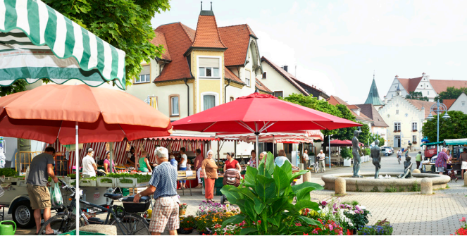
Die Werbegemeinschaft lädt zum verkauffoffenen Sonntag ein.

Buchau und der Federseeeregion, alle Gäste der Stadt sowie natürlich alle Mitglieder, Freunde und Gönner der Zunft ganz herzlich zu diesem Jubiläum ein, das komplett im Freien stattfinden wird.