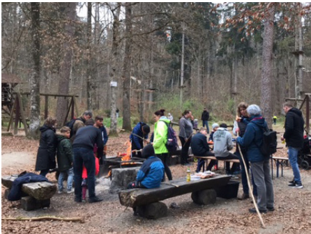
Schnitzeljagd: Familienaktivität bei LERNEN FÖRDERN im Burrenwald