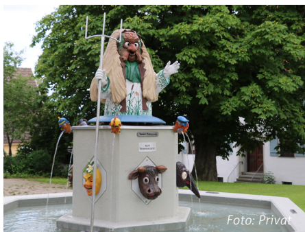
Am 7. und 8. Mai sind alle eingeladen.

Das Wochenende soll am Samstagabend um 16.00 Uhr mit der traditionellen Motorradsegnung bei der Stiftskirche be-