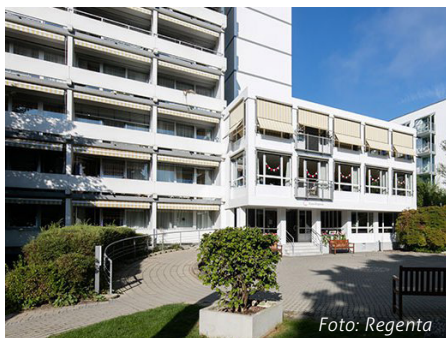
Ein Daheim für 119 Bewohner im Wohn- und Pflegezentrum Haus Regenta.

Nach der Renovierung im Haus Regenta wird für 119 Bewohnerinnen und Bewohner ein neues Zuhause geschaffen. Das