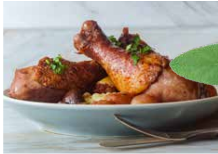
Coq au vin mit Kartoffelstampf anrichten, mit Petersilie und Thymian bestreuen.

Hähnchenteile waschen, trocken tupfen. Keulen in Ober- und Unterkeulen trennen. Brustfilets mit Haut vom Knochen schnei-