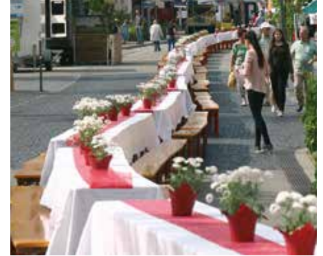
Für eine kulinarische Vielfalt auf der Dinnertafel sorgen insgesamt 16 verschiedene Gastronomen aus Bad Schussenried und der Umgebung.

werten Städte, genannt „Citta Slow“ und hier wird genau das ge- lebt: Regionaltypische Produkte, Geschmack und Qualität, Bewusst- seinsbildung, Kultur und Tradition.