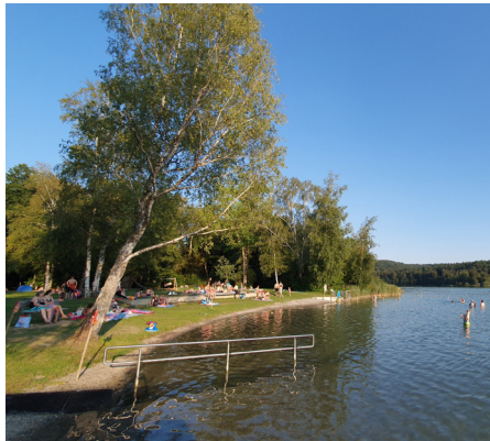
Freizeiterlebnisse und Familienspaß: Mit der Räuberbahn ab Aulendorf einen tollen Familientag am Hoßkircher See erleben oder am 24. Juli mit Musik im Zug oder am 28. August mit Esel-Trecking.

Erkunden Sie das Pfrunger Ried: das zweitgrößte Moorgebiet in Südwestdeutschland mit einsamen Wander- und Radwegen. Geschichte und Geschichten bietet das mittelalterliche Pfullendorf – mit einer Räuberstadtführung oder auf eigene Faust mit dem Audio-Guide auf dem eigenen Smartphone. Vier wunderbare und wenig überlaufenen Naturbadeseen, wie der Königseggsee mit eigenem Bahnhaltepunkt in Hoßkirch, bieten Erfrischung und Familienspaß.