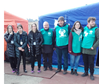
ADRA-Helfer mit Volonteers (Freiwillige)

Hilfe von Mensch zu Mensch im Donauraum neu organisiert. Der neu gegründete Verein beabsichtigt, nachhaltig die Flüchtlinge in Transsilvanien und nach Möglichkeit in Transkarpatien, also direkt in der Ukraine zu unterstützen.