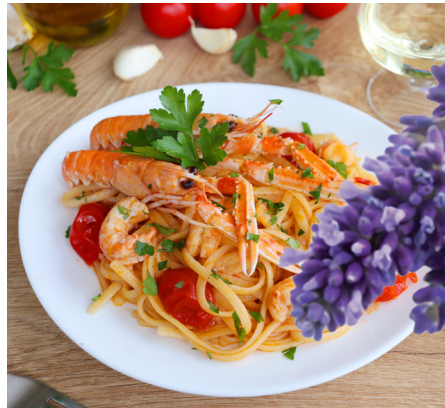
Lavendel-Garnelen mit geschmolzenen Kirschtomaten auf Linguini – ein Gedicht.

400 g Linguini (ersatzweise Spaghetti) 20 Riesengarnelen (8/12) 1 Knoblauchzehe 1 TL getrocknete Lavendelblüten oder zwei Zweige frischer Lavendel 30 ml Olivenöl 50 g Butter 200 g Kirschtomaten 50 ml Weißwein Salz, Pfeffer aus der Mühle