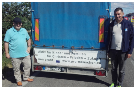
ADRA-Helfer mit Volonteers (Freiwillige)