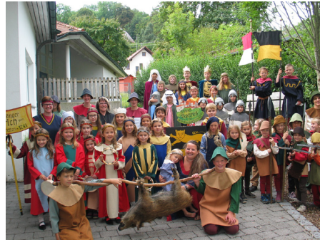
Am 20./21.08. heißt es in Winterstettenstadt wieder Musik, Unterhaltung und Krämer- und Kinder-flohmarkt.

Die Kinder werden an beiden Tagen bes-tens unterhalten. Zu den großen Highlights auf der Bühne vor dem Riefhaus gehört der Auftritt der Schenk-Konrad-Kostümgruppe, die vom Fanfarenzug Graf Humbrecht be-gleitet wird sowie die Vorführungen und das Lagerleben der Hrafnar Wikinger Grup-