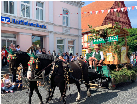
Großer Festumzug am Mangelmontag mit prächtig geschmückten Festwagen.