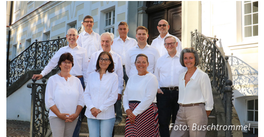
Die neuen Mitglieder der Bürgerstiftung Bad Schussenried stellen sich vor.

Die neuen Mitglieder bedanken sich ganz herzlich beim vorhergehenden Gremium für die gute und erfolgreiche Arbeit sowie für den Aufbau der Stiftung.