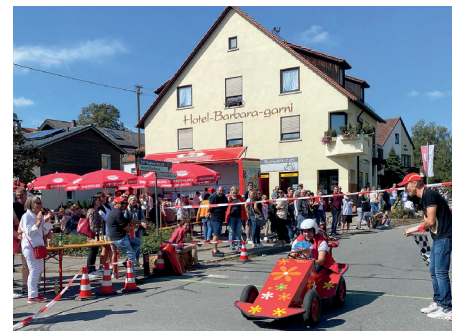
Die richtig guten Seifenkisten werden immer weitergegeben und fahren so über Jahrzehnte mit.