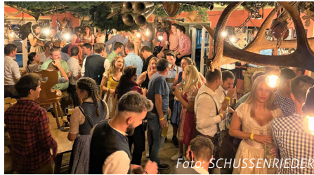
SCHUSSENRIEDER Oktoberfest in der Brauereigaststätte

Am Sonntag, 02. Oktober lädt die SCHUSSENRIEDER Brauerei Ott zum Familientag in die Brauereigaststätte, bei einem Weißwurst-Frühschoppen ab 11 Uhr mit Live-Musik und freiem Eintritt ein. Begeben Sie