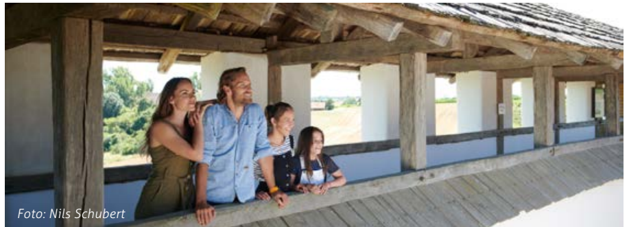
Mit der ganzen Familie Muttertag auf der Heuneburg feiern.