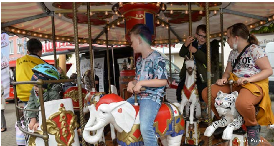
Für Groß und Klein bieten Vereine, Fachgeschäfte, kompetente Dienstleister, einladende Cafés und Gaststätten am verkaufsoffenen Sonntag Infos, tolle Angebote und alles, was das Herz begehrt.

Autointeressenten können sich bei einer Fahrzeugschau der Marken Opel und Fiat von Autohaus Schlegel über die neuesten