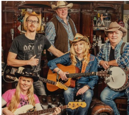
Am Festabend, 24. Juni spielen Saddle'n Boots

Start des Festwochenendes ist am Samstag mit einem US-Car- und -Bike-Treffen sowie Live-Musik mit Paddy & The Rocking Rebels. Am Abend findet bei der Turnhalle ein Heavy-Metal-Festival und gleichzeitig in der OMV-Halle ein Country-Abend mit Saddle n' Boots sowie Linedance-Gruppen statt. Am Sonntag bietet der Verein dann den Klassiker, das Oldtimertreffen auf dem Freigelände, bei dem es vieles zu Bestau-