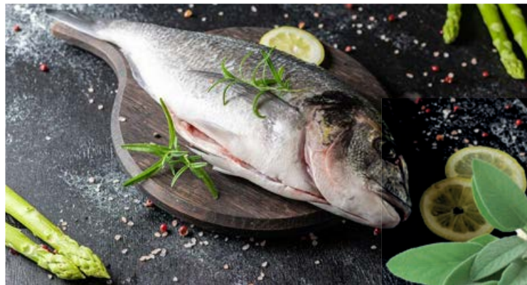
Spargel in Tomaten-Salbei-Ragout mit gegrillter Dorade

500 g Spargel 400 g Kirschtomaten 100 g getrocknete Tomaten 150 g Butter 50 ml Weißwein 80 ml Olivenöl 1 Bund Salbei Salz, Zucker, Pfeffer aus der Mühle 4 Filets von der Dorade 1/2 Zitrone 700 g neue Kartoffeln