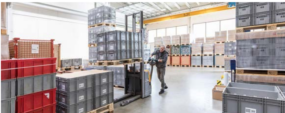
Sanierte Montage & Verpackung mit Lagerfläche

Damit der DORNAHOF seinem Anspruch bestmöglich gerecht werden kann, bietet er heute ein breites Spektrum an Leistungen. Klient*innen des Einrichtungsverbundes