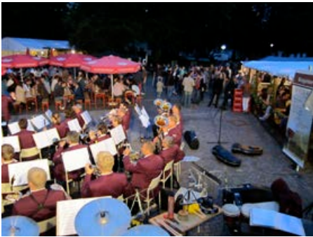
Der RMSV Bad Schussenried freut sich, dass die Tour de Barock wieder zusammen mit dem Parkfest stattfinden kann.