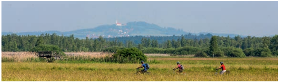
Beim Radeln oder Wandern durch Bad Schussenried und Bad Buchau lacht die Seele.