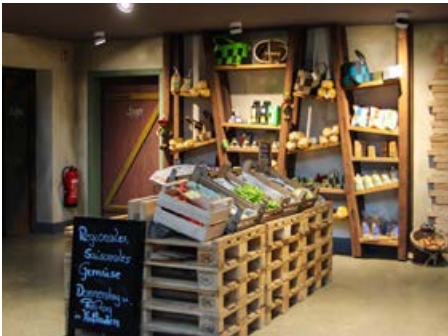
Der Hofladen in Sattenbeuren ist täglich geöffnet.

chen es der Staude nicht leicht, obwohl sie eigentlich ein sehr genügsames Gewächs ist.