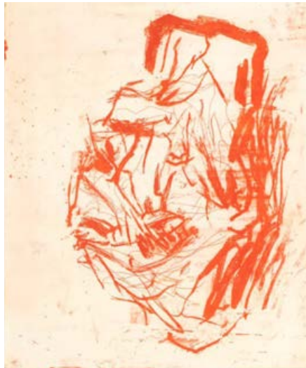
Devotion Suite – Otto Dix, 2018, Radierung mit Aquatinta u. Zuckerätzung Leihgabe Private liechtensteinische Sammlung

Im Januar 85 Jahre alt geworden, gehört der gebürtige Sachse mit seinem figurenstürzenden Weltbild nicht nur zu den etabliertesten Künstlern, sondern vermittelt ein facettenreiches und thematisch oft auch ambivalentes Oeuvre, das zum Kanon der zeitgenössischen Kunst zählt. Einen wichtigen Werkkomplex von Baselitz stellen Personen und Porträts dar. Baselitz begeistert Selbstbildnisse von Malern und Komponisten und dienen als Vorlage für seine Grafikerie »Devotion«. Als Liebhaber der Musik von Arnold Schönberg und Wolfgang Rihm