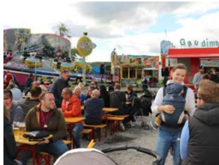
Geselliges Beisammensein auf dem Festplatz