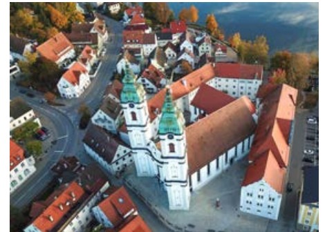
Am 16. und 17. September findet die 59. Kurzstreckenregatta in Bad Waldsee statt

Damit gehört die Kurzstreckenregatta, bei der die Sportlerinnen und Sportler 500 m in allen Bootsklassen vom Einer bis zum Achter zurücklegen, zu einer der ältesten Ruderregatten in Baden-Württemberg. Das Event lockt jedes Jahr aufs Neue hunderte Sportler aus dem gesamten süddeutschen Raum sowie den benachbarten Ländern Österreich, Schweiz und Tschechien auf den gerade mal 600 m langen See. Die Regatta ist bekannt für ihre tollen Ruderbedingungen auf sechs Startbahnen vor der