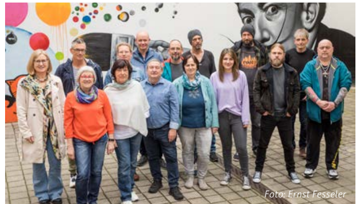
Am 22.09.2023 von 12 bis 15 Uhr lädt der DORNAHOF Ravensburg - Württemberger Hof herzlich zum „Tag der offenen Tür“ ein.

Seit dem Beginn hat der DORNAHOF Ravensburg - Württemberger Hof seine fachlichen Unterstützungsangebote und Notfallhilfen stetig weiterentwickelt und ausgebaut. Das geht nur mit guter