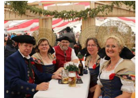
Ein Augenschmaus: Historische Trachten der Stadt Bad Schussenried