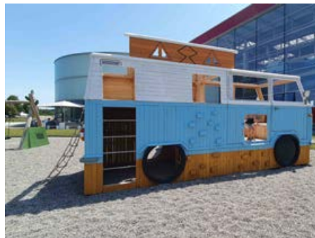
Highlight des Spielplatzes ist ein lebensgroßes Kletter-Reisemobil aus Holz.