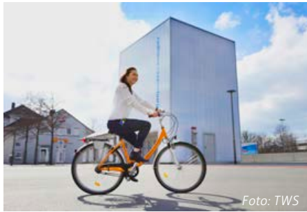
Das Radhaus am Ravensburger Bahnhof ist seit Juli ausgelastet.

Mit zunehmender Nutzung und Wertigkeit des Fahrrades sei auch die sichere Aufbewahrung interessanter geworden. „Das Radhaus ist kein saisonales Angebot, sondern hat mittlerweile einen festen Platz in