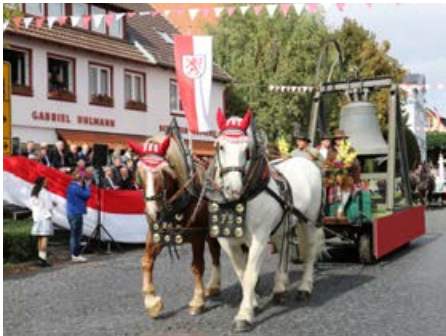
Historischer Festumzug am Mangelmontag mit prächtig geschmückten Festwagen.