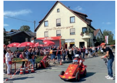
Die richtig guten Seifenkisten werden immer weitergegeben und fahren so über Jahrzehnte mit.