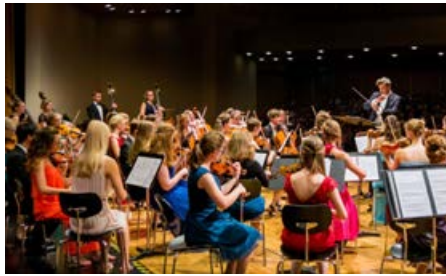
Die Junge Philharmonie Oberschwaben spielt am 23.09.2023 im Kurzentrum.

Klassik pur bietet der 2. Programmpunkt des Abends: Wolfgang Amadeus Mozart (1756-1791) göttliche Jupiter-Sinfonie (Sinfonie Nr. 41 C-Dur, KV 551) ist für viele Musikliebhaber und Kritiker nicht nur sei-