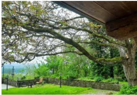
Genießen Sie ein naturnahes Ambiente

Das traumhafte Gebäude befindet sich hoch über dem Schussental, malerisch auf einer Anhöhe gelegen, und bietet einen einzigartigen Ort für besondere Anlässe. Das atemberaubende Alpen-Panorama und das märchenhafte, naturnahe Ambiente sorgen für begeisterte Herzen der Besucher. Die