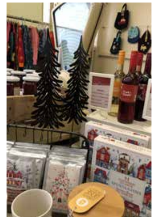
Handgefertigtes und Selbstgemachtes aus dem Hofladen zum Verschenken oder selbst genießen.

Es gibt handgefertigte Adventsgestecke, Vasen und Schalen, Schmuck, Dekoratives und Nützliches aus Holz, Beton, Wolle und Stoff. Zinser Hofladen bietet wie immer eine Vielfalt an verschiedenen Produkten, alles selbst hergestellt und garantiert ohne Zusatz- bzw. Konservierungs- und Farbstoffe. Im Angebot sind beispielsweise viele verschiedene Konfitüren. Auch das Sirup-Sortiment mit verschiedenen Sorten, wie Holunderblüten- oder Bratapfelsirup sind nicht nur ein Hingucker, sondern schmecken auch nach dem, was drauf steht.