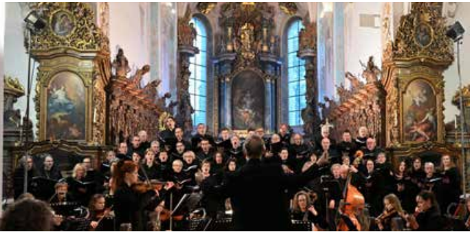
Chor & Orchester Sankt Magnus – Konzert in Bad Schussenried