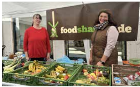
Bei Foodsharing kann jeder mitmachen!

Nehmen wir der Tafel dabei Lebensmittel weg? Nein! Die Tafel und sonstige soziale Einrichtungen haben immer Vorrang. Food-