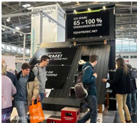
Der Messestand von equatronic genoss großes Interesse unter den zahlreichen Besuchern

Mit equatop - ThermoPV erzeugen Dach oder Fassade zusätzlich zum Strom den Wärmebedarf eines Gebäudes ohne thermische Isolation. Die revolutionäre Dachanlage gewinnt bis zu 250% mehr Sonnenenergie als herkömmliche PV-Systeme. Sie erzeugt Strom und nutzt zusätzlich die Abwärme für effizientes Heizen durch die Wärmepumpe. Häuser werden so zu ökoefizienten Wohngebäuden und sparen, unabhängig von der Energieeffizienzklasse und ohne zusätzliche Sanierungen, 65% und mehr der Heizkosten ein. Durch die optionale Integration einer equatronic Erdwärmebatterie kann auf bis zu 100% fossile