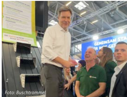
Bundesminister Robert Habeck erwies sich als Gipfelstürmer beim Erklimmen des equatop-Modells auf der IHM München