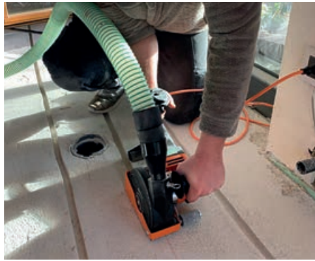
Eine saubere Sache: Nachrüstung einer Warmwasser-Fußbodenheizung im bereits vorhandenen Estrich.

Wie funktioniert dieses innovative Verfahren? In Ihren vorhandenen Estrich werden Kanäle eingefräst und Heizrohre eingelegt. Ein großer Vorteil dieser neuen Methode ist, dass die Aufbauhöhe des Estrichs nicht