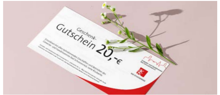
Geschenktipp für Ostern und Kommunion: Ein Gutschein des GHV kann bei allen teilnehmenden Einzelhändlern, Handwerkern und Gastronomen eingelöst werden.

Ein toller Geschenktipp ist ein Gutschein des GHV. Dieser ist das ideale Geschenk für Ostern, Kommunion und für viele weitere Anlässe. Sie erhalten den Gutschein in der Raiffeisenbank, Kreissparkasse, Volksbank, im Reisebüro Rommel und im Rathaus an der Tourist-Info. Der Gutschein kann bei allen teilnehmenden Einzelhändlern, Handwerkern und Gastronomen des Gewerbe- und Handelsvereins Bad Schussenried eingelöst werden.