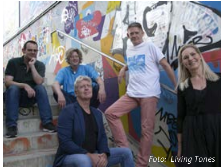
Am 15. März 2024 findet die 27. Biberacher Musiknacht statt. Unter anderem mit dabei: Die Band Living Tones aus München.

Einmal Eintritt bezahlen, 19x Livemusik genießen - Kurzentschlossene bezahlen 15 Euro an der Abendkasse, günstiger wird es mit 12 Euro im Vorverkauf, durch den man sich auch mögliche Wartezeiten an den Abendkassen erspart.