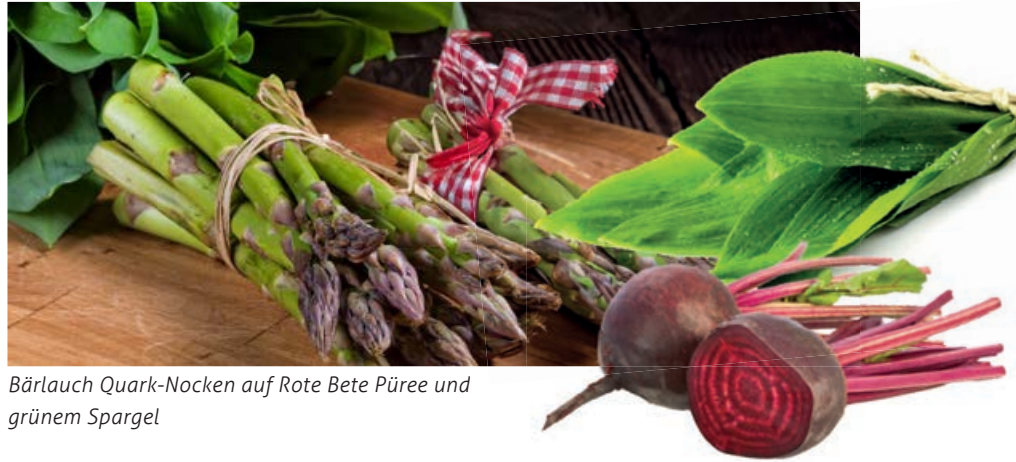
Bärlauch Quark-Nocken auf Rote Bete Püree und grünem Spargel

Die Rote Bete in kleine Würfel schneiden, mit dem Olivenöl kurz anschwitzen, dann mit dem gezupften Thymian, Kreuzkümmel,