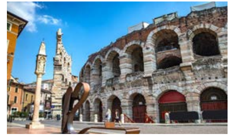
„Alte Hilde“ erkundet Italien: Eine unvergessliche Reise voller Kultur und Charme vom 3. – 6. Okt. '24

kunden ihre versteckten Ecken und besuchen sogar eine authentische Maskenwerkstatt und die berühmte Gondelwerft. Der dritte Tag führt Sie auf die Insel Murano, weltbekannt für ihre Glasindustrie. Erkunden Sie die charmanten Gassen, bewundern Sie die Kunst der Glasbläserei und lassen Sie sich von der Schönheit dieser einzigartigen Insel verzaubern.